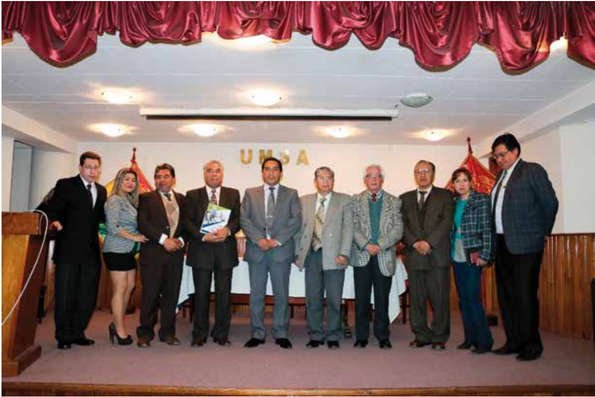
Autoridades Facultativas y Autores del Texto de la Cátedra de Farmacología