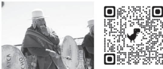
Figura 3: Sincronización entre la interpretación del Bombo y Siku

Nota. Fuente: Elaboración propia, y en base a https://www.youtube.com/watch?v=IHbxZlQK04o