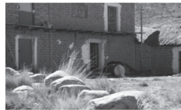
Figura 4: Casa de un “Phusiri” (soplador, interprete)

En la imagen podemos observar la casa de un “Phusiri” al lado de una de las puertas se encuentran sus instrumentos. También se pudo escuchar al viento soplando con tal intensidad que hacía vibrar a los instrumentos musicales y al ambiente en general. Según Willems (2011) “Este entrenamiento auditivo debería realizarse ante todo en el círculo familiar.” Un primer ingreso al entendimiento de la funcionalidad didáctica en sus actividades cotidianas se debe a su futuro como miembro del conjunto de los Sikuris de Taypi Ayca – Italaque. Schafer (1994) menciona que “(...) las sociedades escuchan de modos distintos.” Se considera que el contexto de la sensorialidad auditiva está vigente y es un punto relevante a considerar en la elaboración de las estrategias didácticas que se relacionan a la educación del oído musical.