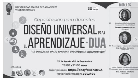
Figura 3. Fotografía de la invitación a la Capacitación