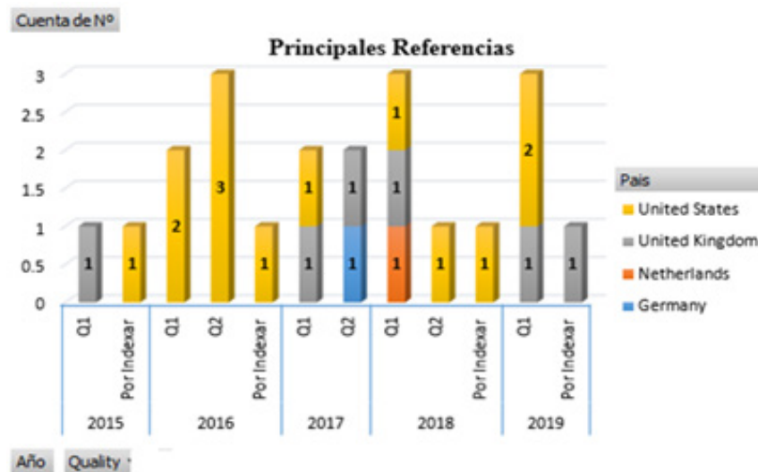
Figura 4. Análisis de artículos seleccionados.

investigación, preferentemente en idioma inglés de los Estados Unidos, Reino Unido, Holanda y Alemania. Del mismo modo, la mayor proporción de los 21 research papers seleccionados, es decir 17, están incorporadas por Scimago Institutions Rankings en los Cuartiles 1 y 2. (Figura 4).