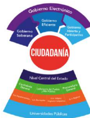
Gráfico Nro. 2: Esquema general y visión de Gobierno Electrónico